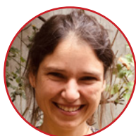
Katrien Vervoort (ter vervanging van mevr. De Gieter Eva, Koninklijk Besluit van 28 april 2019, gepubliceerd op 14 mei 2019)